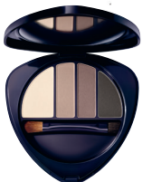
Eye & Brow Palette