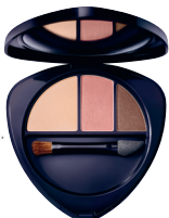
Eyeshadow Trio 04