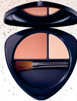
Blush Duo '01